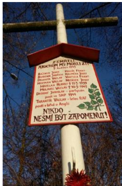
Pomník padlým za II. sv. války u debšského hřbitova