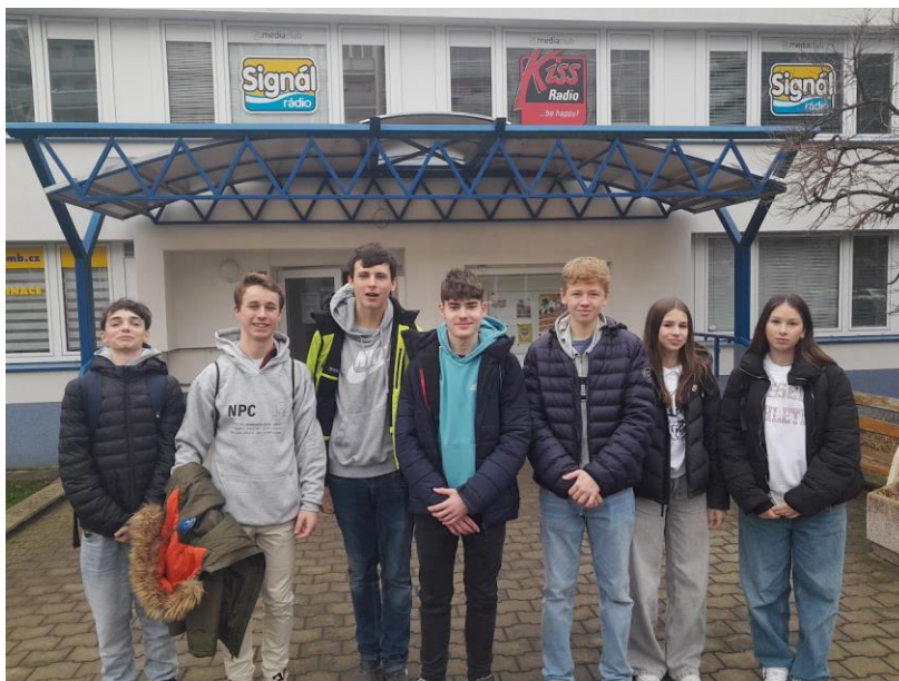
Návštěva rozhlasového studia