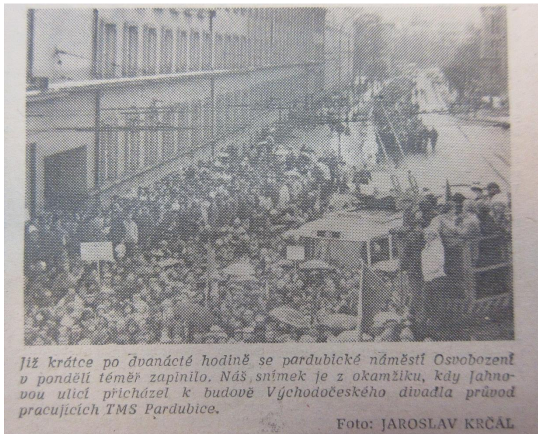
Již krátce po dvanácté hodině se pardubické náměstí Osvobození v pondělí téměř zaplnilo. Náš snímek je z okamžiku, kdy Jahnovou ulicí přicházel k budově Východočeského divadla průvod pracujících TMS Pardubice.