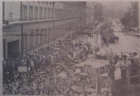
Již krátce po dvanácté hodině se pardubické náměstí Osvobození v pondělí téměř zaplnilo. Náš snímek je z okamžiku, kdy Jahnovou ulicí přicházel k budově Východočeského divadla průvod pracujících TMS Pardubice.

Okresní výbor Komunistické strany Československa v Pardubicích oznamuje, že v budově OV KSČ (nábřeží Československé armády) byla v prostorech Domu politické výchovy