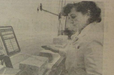
Dílně Kněžský nářezu Apolo zabalené nakoupen se už na automatické váze, která "vydává" listky s potřebnými dáji o