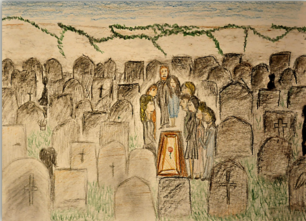
Léta smutku (autorka Jasmin Neuwirthová)

dvašedesátým maminka, ve třiašedesátém manžela maminka a ve čtyřiašedesátém tatínek. To jsem měla čtyři roky teda... to bylo špatný.“