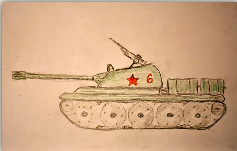
Ruský tank