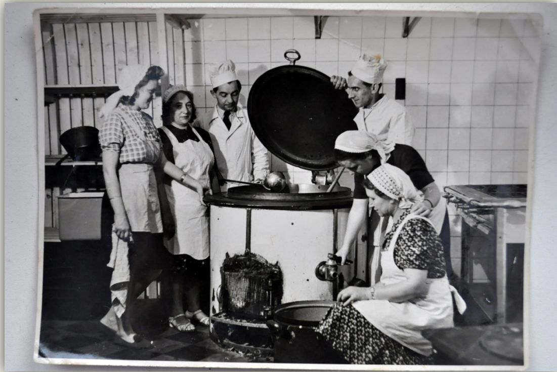
Práce v kuchyni

„A obyčejně to bylo tak v jedenáct hodin dopoledne, to začaly houkat sirény a byl hlášený poplach teda, jo. A my jsme utíkali – jestli znáte, tady jak je hlavní nádraží, tak jsme běželi tam pod ten most a tam byl vlastně kryt. Z jedné strany to bylo uzavřené úplně a z té co my jsme jako šli od toho hlavního nádraží dolů, tak tam byly vrata, no a byl tam jako i lékař tam kolikrát byl, jo, kdyby se něco přihodilo...“