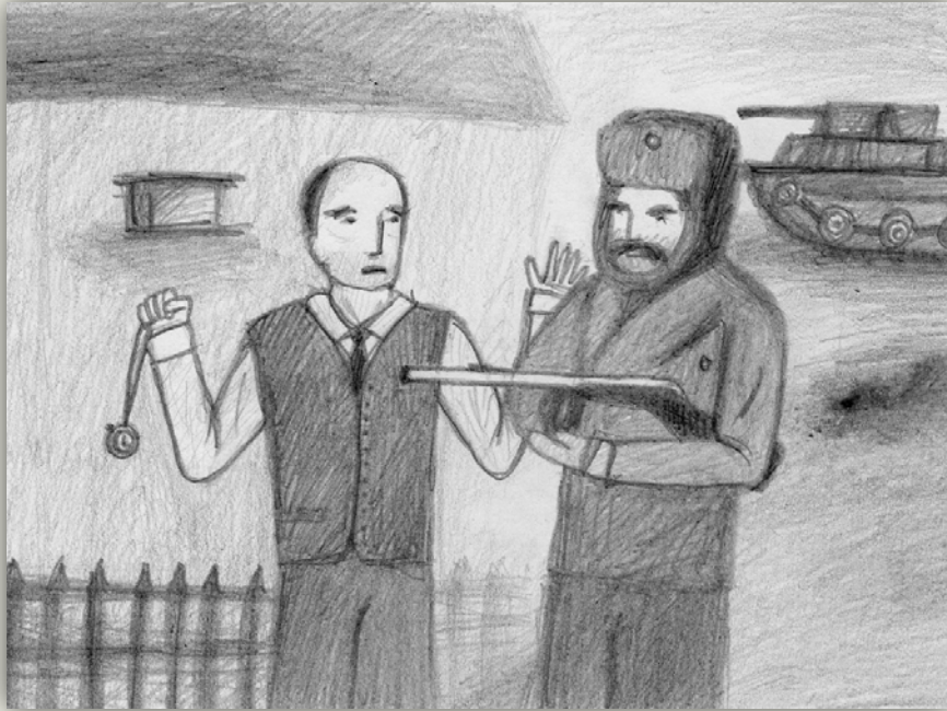
Zážitek s Rusy (autorka M. Váhalová)