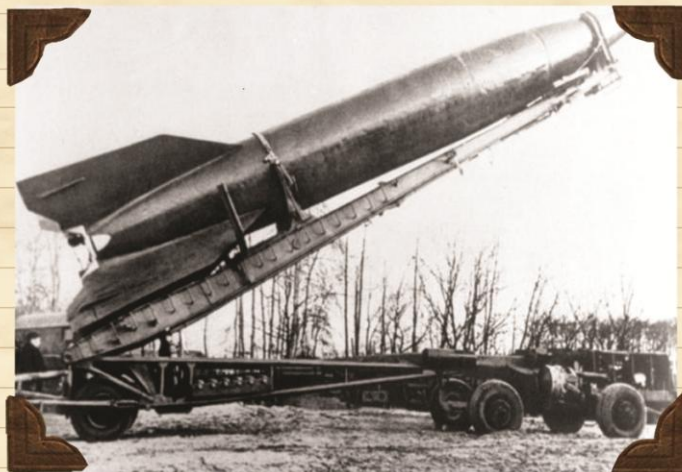
Hitlerova tajná zbraň