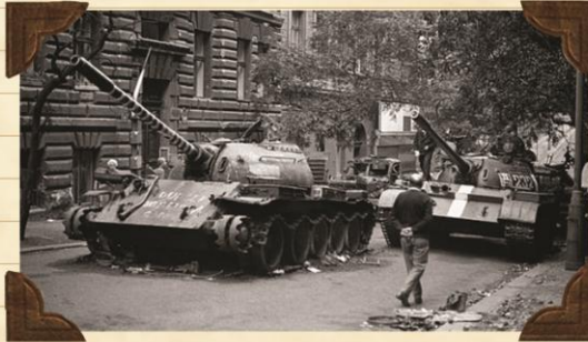
Okupace roku 1968

Dodnes je ale tak trochu levicově zaměřen, nesoouhlasí s tím, že je na světě tolik milionářů, co si svoje peníze vydobyli nekalými praktikami a přitom je stále mnoho lidí, co hladoví.