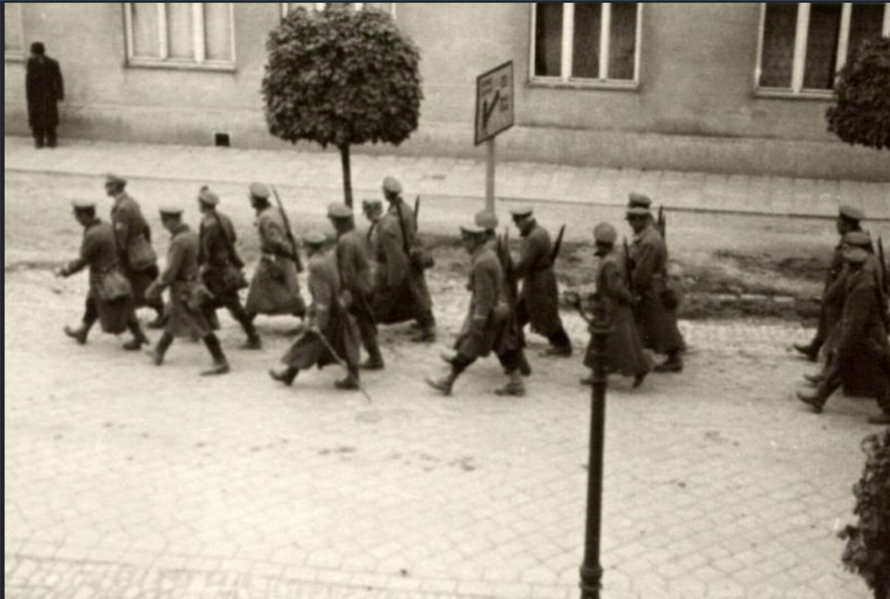
Postupující Rudá armáda