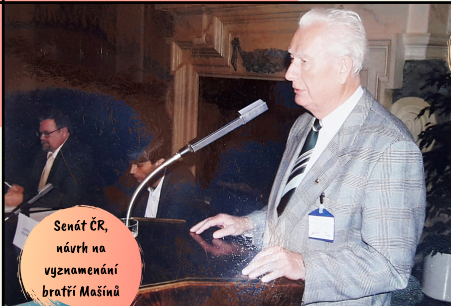
Senát ČR, návrh na vyznamenání bratří Mašínů