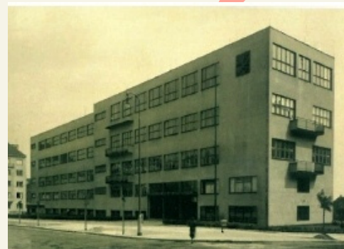
Gymnázium na náměstí Jiřího z Lobkovic kolem roku 1940