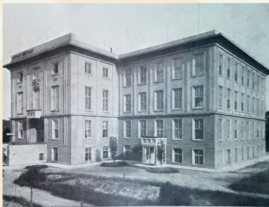
Sirotčinec na Vinohradech