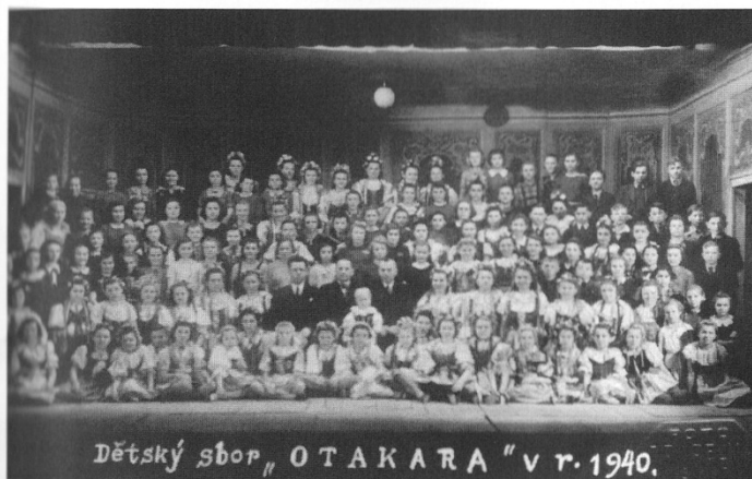
Tatínkův dětský sbor

let později. Skauti a skautky zajišťovali pořádkovou službu, přenos zpráv a řídili dopravu. Činnost nedobrovolně přerušena sloučením se Československým svazem mládeže roku 1949. Někteří skauti dále pracují pod hlavičkou ČSM, jiní svoji aktivitu končí. Obnovení skautingu se setkává s velkým zájmem dětí i rodičů roku 1968.