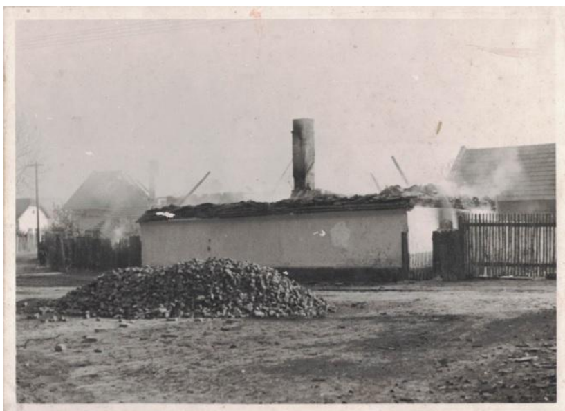
Vypálení Konětop 1945

Jindřišce Herclíkové, která bydlela v sousední vesnici Dřísy, bylo 17 let, když na konci války 7. května 1945 partyzáni přepadli kolem páté odpoledne na návsi projíždějící autobus plný německých vojáků. Po přestřelce, kde na obou stranách zůstávají mrtví, partyzáni odjíždějí a nechávají zde místní občany bez pomoci. Německá posila dorazila po půlnoci a zapálila vesnici. Oheň se velmi rychle šířil, lidé utíkali, aby neuhoreli, neudusili se nebo nebyli zastřeleni.