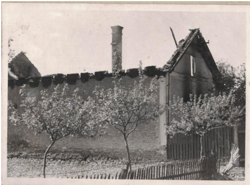
Vypálení Konětop 1945

„ Jsme bydleli u rybníka a takže jsme měli okna ke Konětopům. Já jsem se dívala k večeru takhle jako ven. A teď říkám: „Tatínku tamhle je taková hrozná záře, někde hoří“. Tatínek se šel podívat a říká: „ Že by to bylo až v Mladé Boleslavi?“ Já říkám :„, Ne, to není možný. Z Mladé Boleslavi by to nebylo vidět. To je hodně daleko.“ A byli to ty Konětopy. To bylo nad tím lesem.....to hořelo všechno. Bylo to prostě ošklivý“