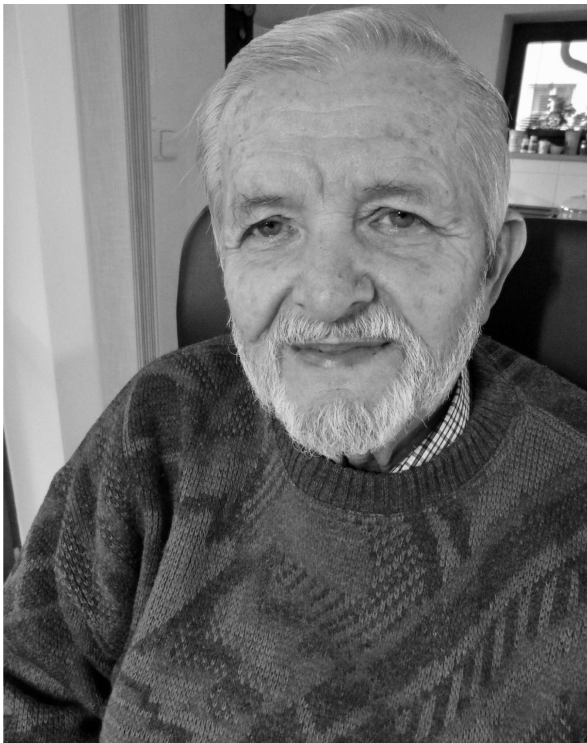
Pan Částka dnes