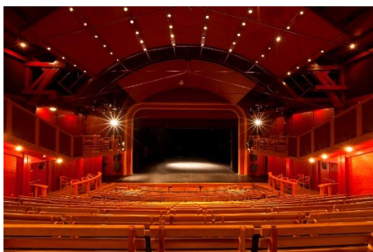
Divadlo Na Fidlovačce