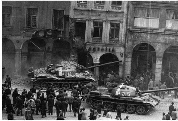
Vojska Varšavské smlouvy