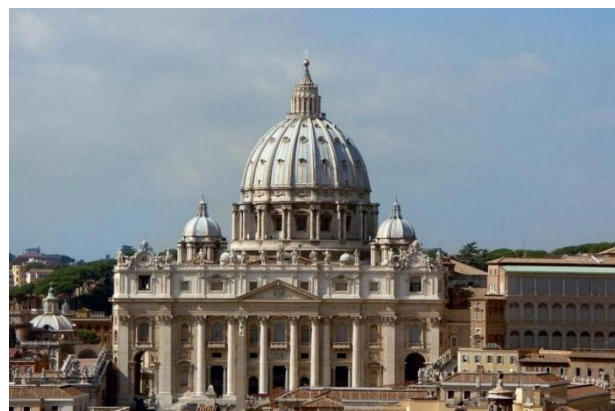
Bazilika svatého Petra ve Vatikánu