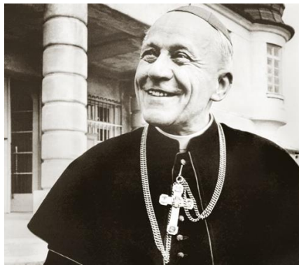
Kardinál Josef Beran