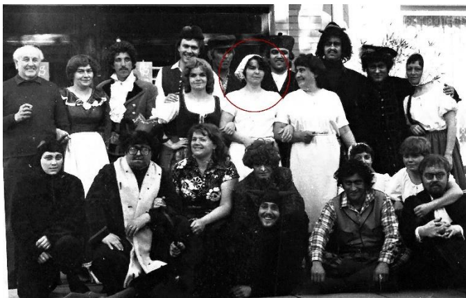
Divadelní kroužek Lužec nad Vltavou a jejich představení Dalskabáty hříšná ves.