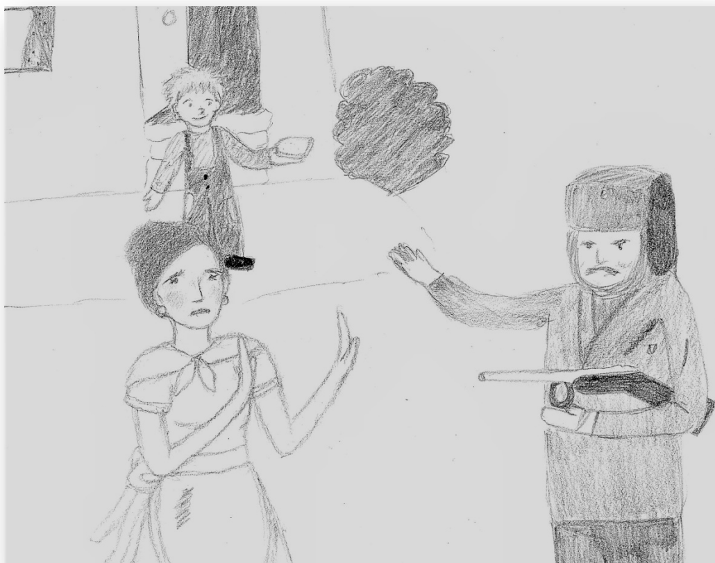
Vyhrožující ruský voják