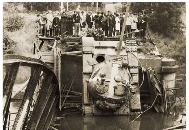
Rok 1968 – dvorský most pobořený ruským tankem

„Já jsem přišel do práce a tam mi řekli, že tady jsou Rusáci a že spadli s tím tankem na mostě do Dvorů. A já jsem se zeptal, kdy se to stalo. A jeden z těch mých spoluzaměstnanců řekl, že asi před půl hodinou. Ale před půl hodinou tam šla plus minus ta moje novomanželka. Tak já jsem sedl na kolo a jel jsem se k tomu mostu podívat. Ale oni mě tam ti vojáci nepustili. Nevěděl jsem, co se jí stalo.“