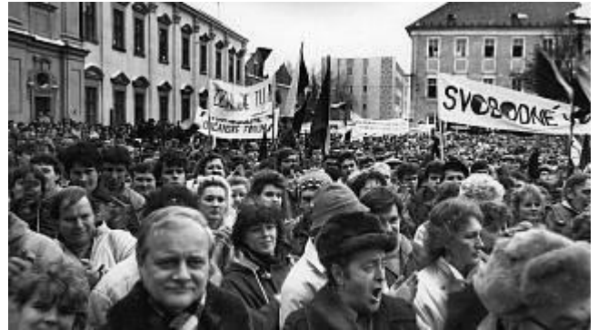
Rok 1989 v Karlových Varech