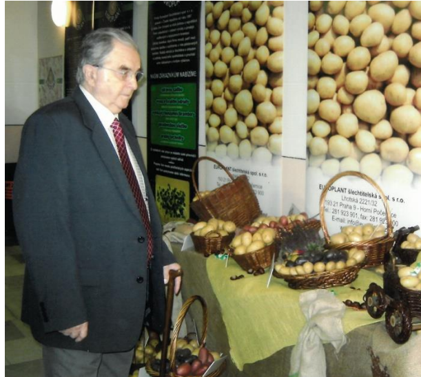
pan Jun na bramborářské výstavě

Bramborám, jejich historii a pěstování tedy zasvětil velkou část svého života. Stal se významným odborníkem v této oblasti, přednášel, napsal o bramborách 4 odborné knihy a 18 vědeckých prací. Procestoval mnoho zemí, kde se setkával s tamějšími pěstiteli a šlechtiteli brambor. Rovněž dokázal, že brambory pocházejí s Peru a v Havlíčkově Brodě se setkal s peruánským velvyslancem, který mu za výzkum v oblasti brambor osobně poděkoval.