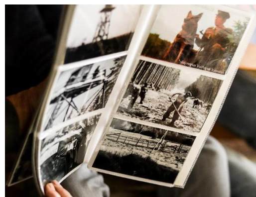
Obrázek SEQ Obrázek 3 ARABIC 3: fotky od pana Babora