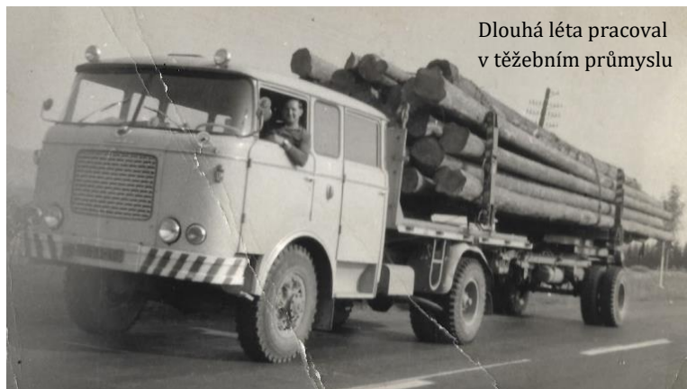
Dlouhá léta pracoval v těžebním průmyslu

„Musel jsem nejdřív ukázat, že prostě něco umím.“