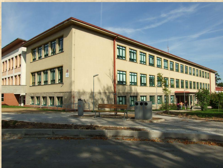
Gymnázium Moravské Budějovice