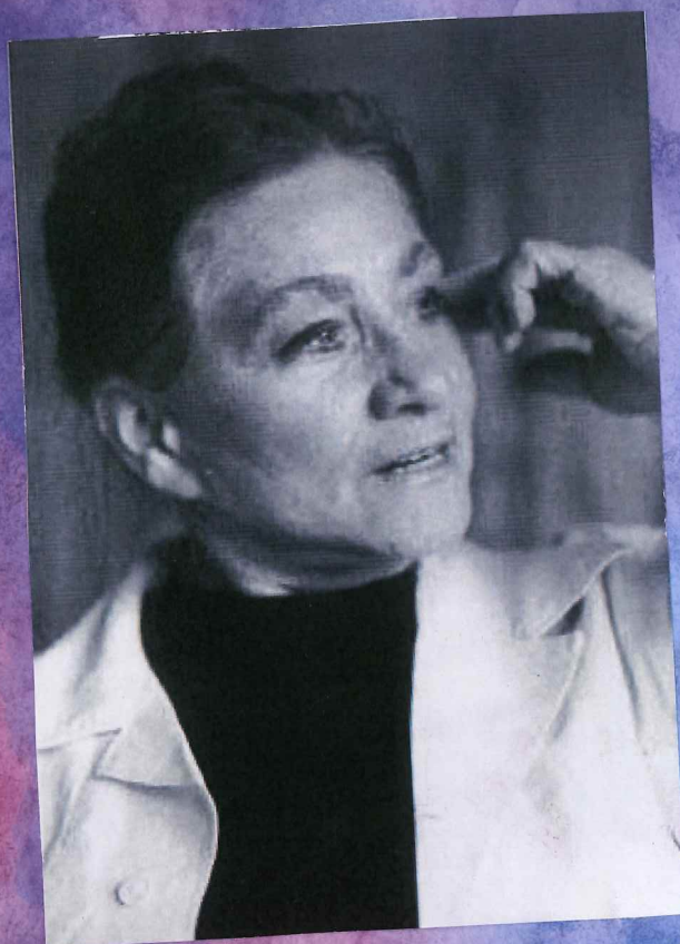
Narodila se v Praze, 24.12.1930 Je známá jako úspěšná výkladová návrhářka, výtvarnice a baletka.

V jarním ránu na berounské stráni dobrá mysl ode zlého chrání.