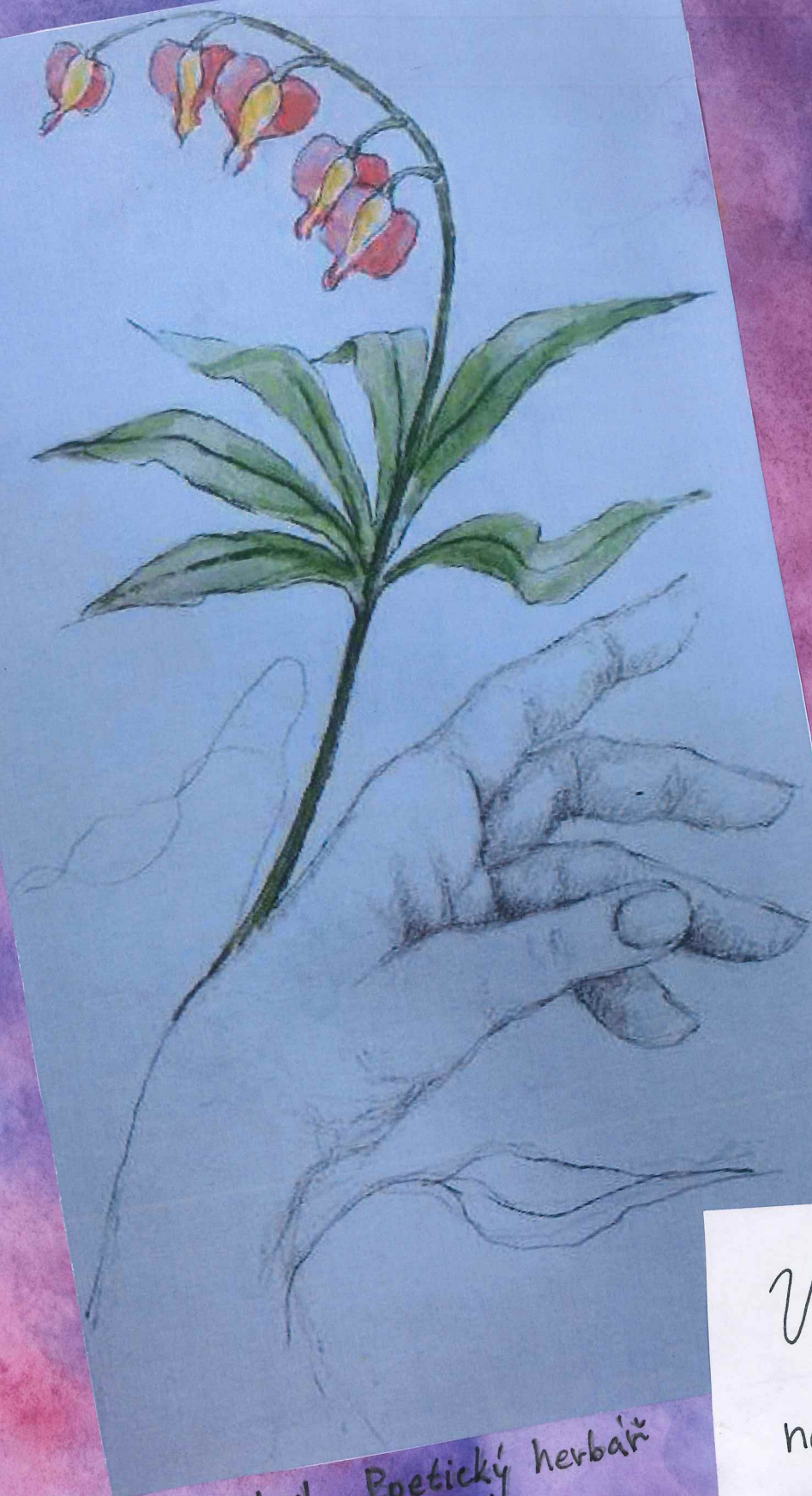
Dílo z knihy Poetický herbář napsala: Dagmar Renertová