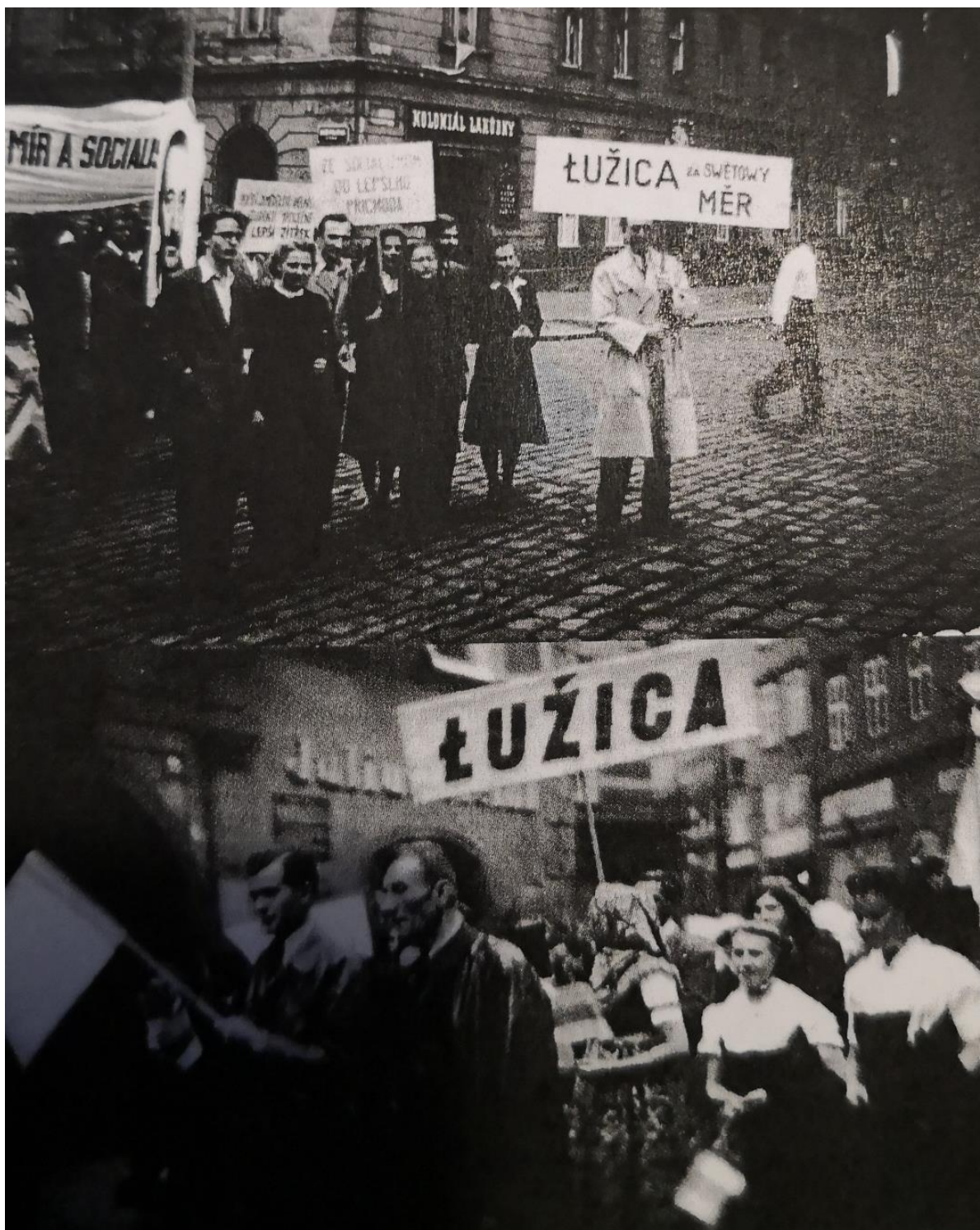
Z prvomájového průvodu v Lužici (rok neznámý)