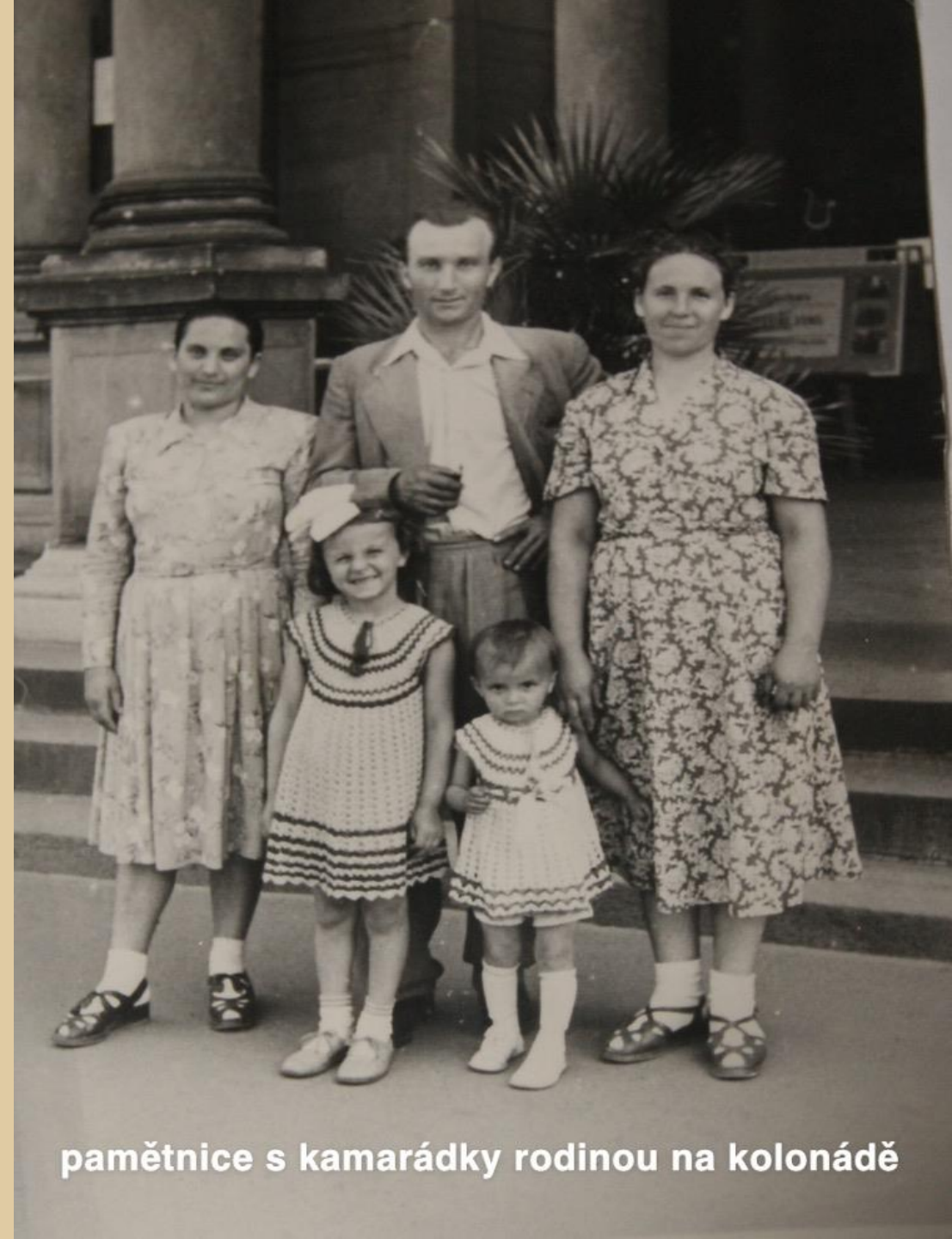
pamětnice s kamarádky rodinou na kolonádě