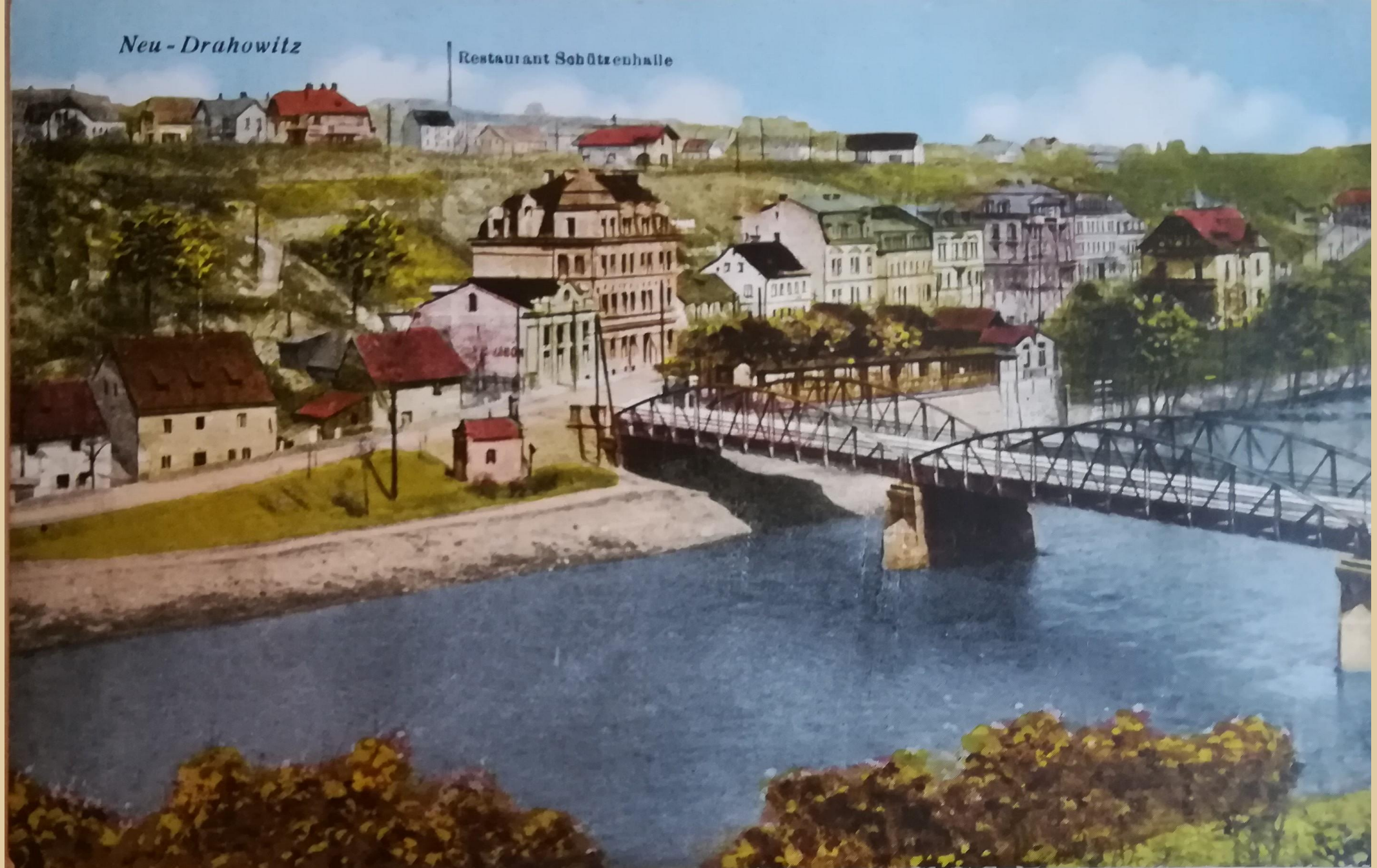
SOKA K. Vary, fond Obecní úřad Drahovice, kronika