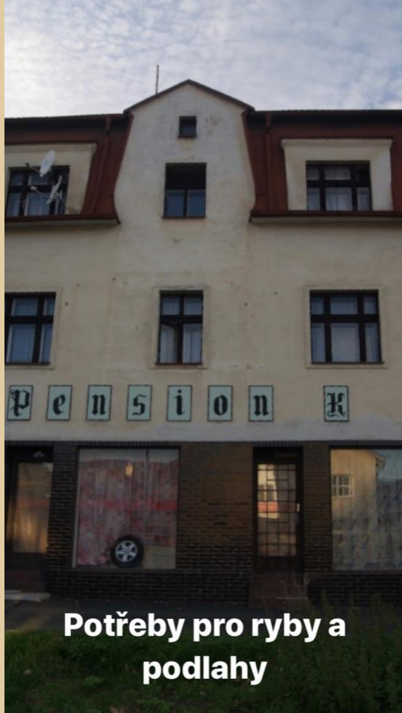
Potřeby pro ryby a podlahy