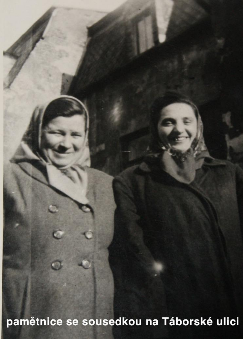
pamětnice se sousedkou na Tábořské ulici