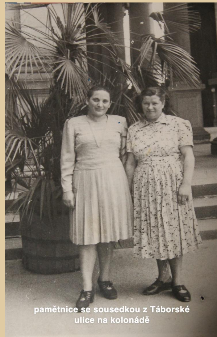
pamětnice se sousedkou z Táborské ulice na kolonádě