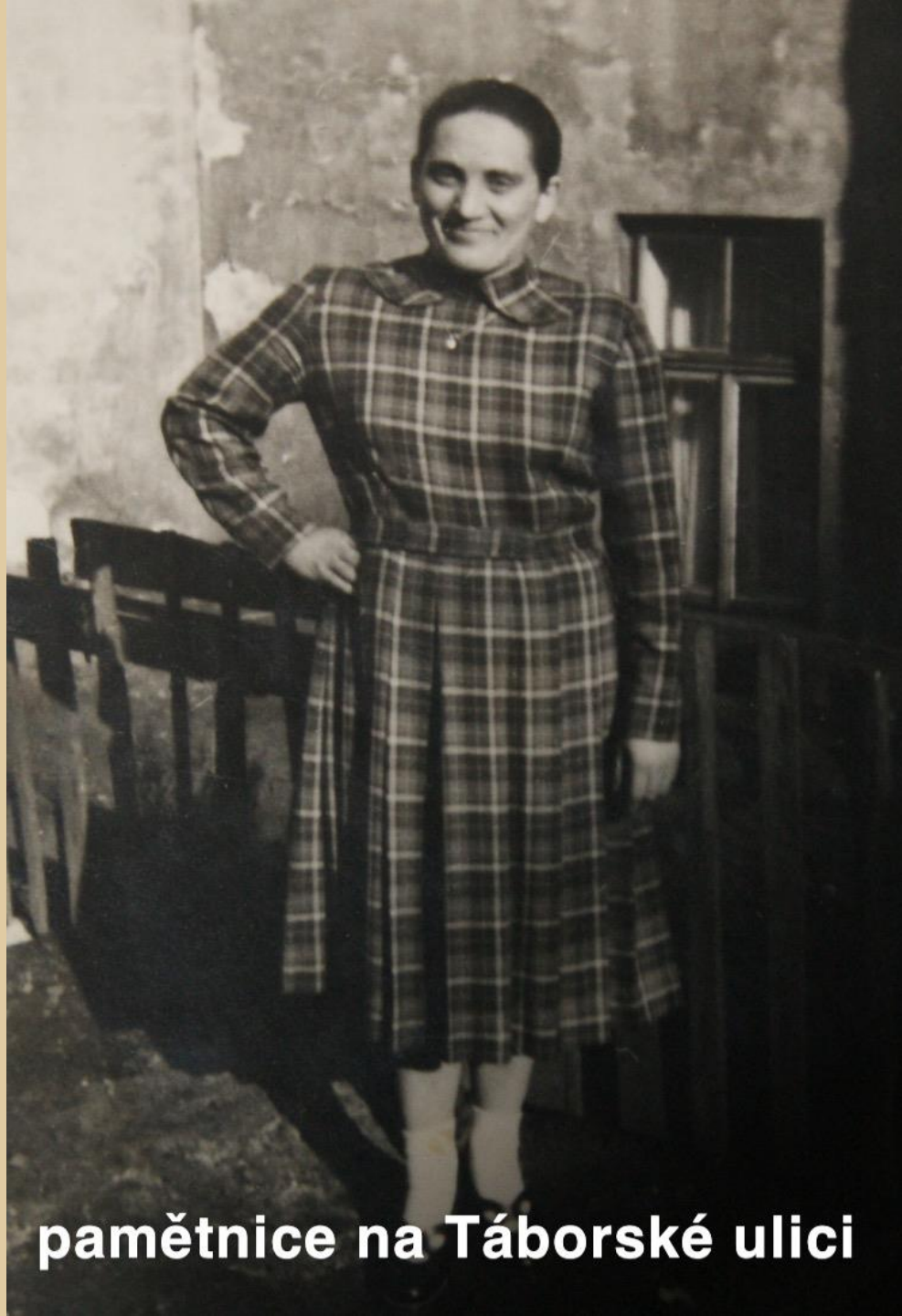
pamětnice na Tábořské ulici