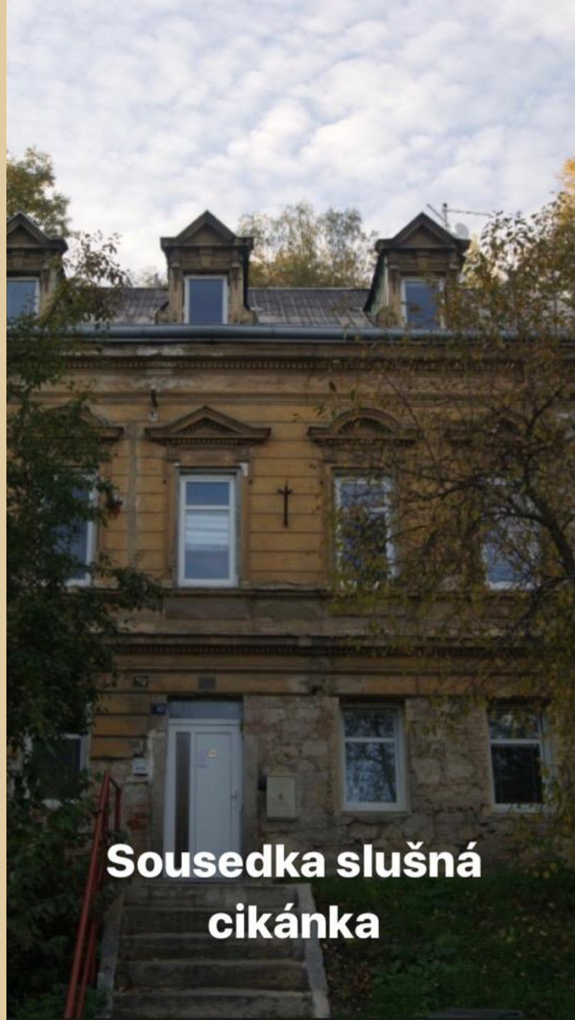
Sousedka slušná cikánka