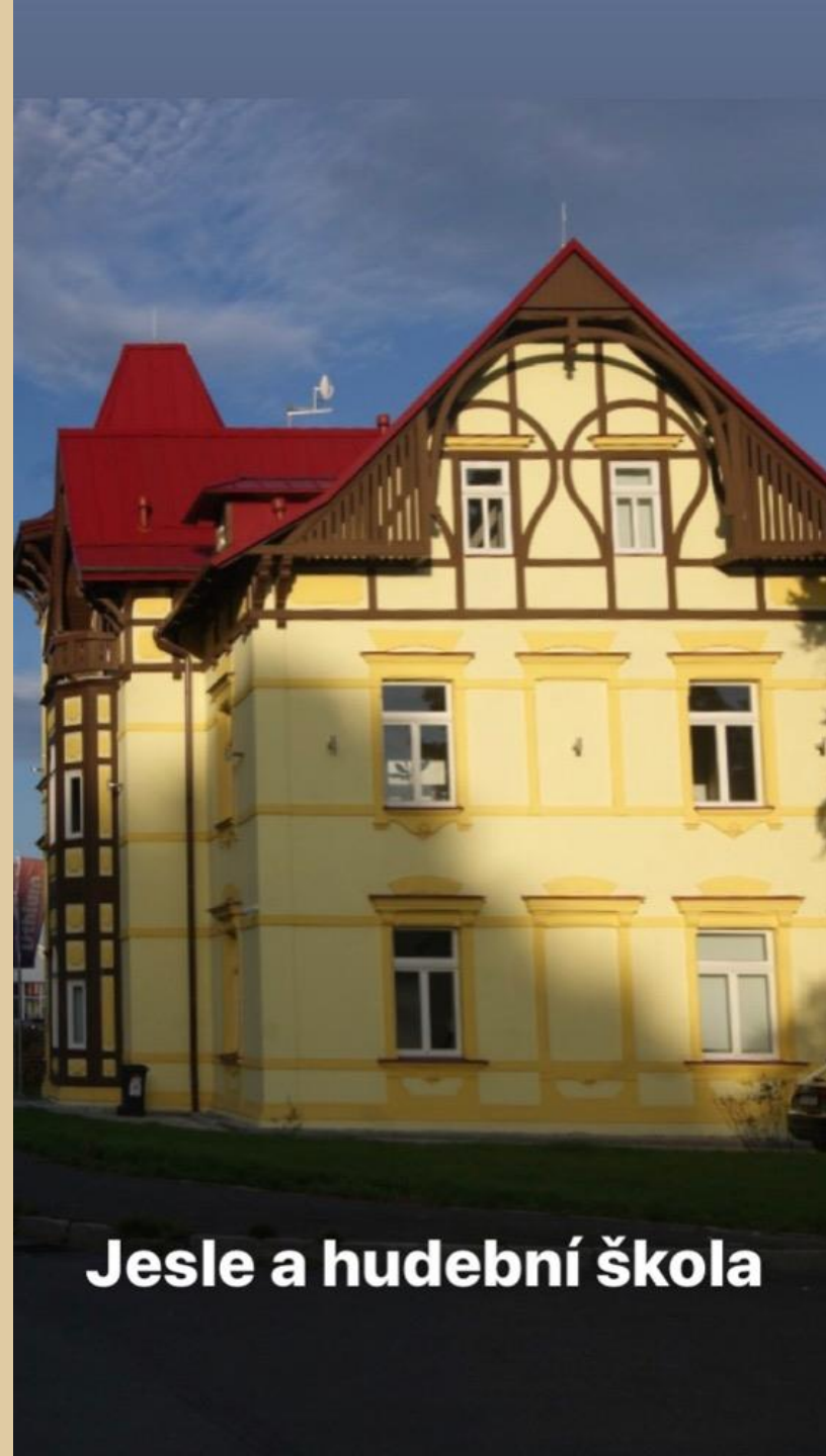
Jesle a hudební škola