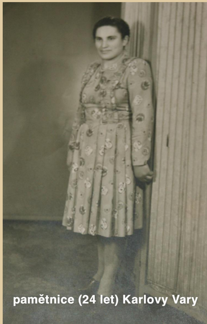
pamětnice (24 let) Karlovy Vary