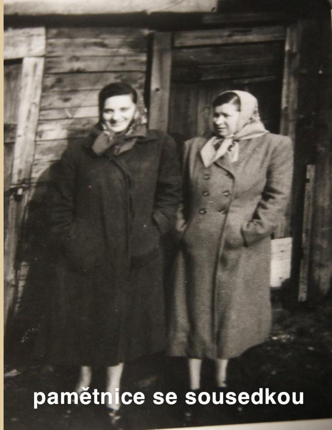
pamětnice se sousedkou