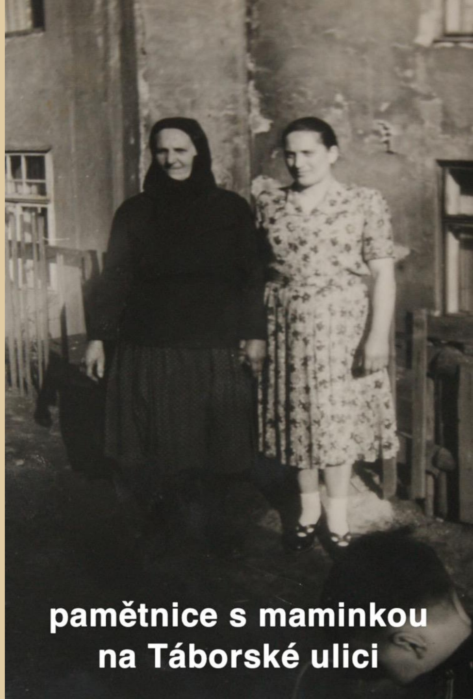
pamětnice s maminkou na Tábořské ulici