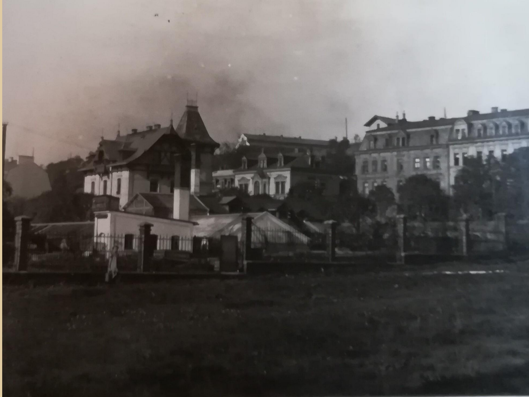
SOKA K. Vary, fond Obecní úřad Drahovice, kronika