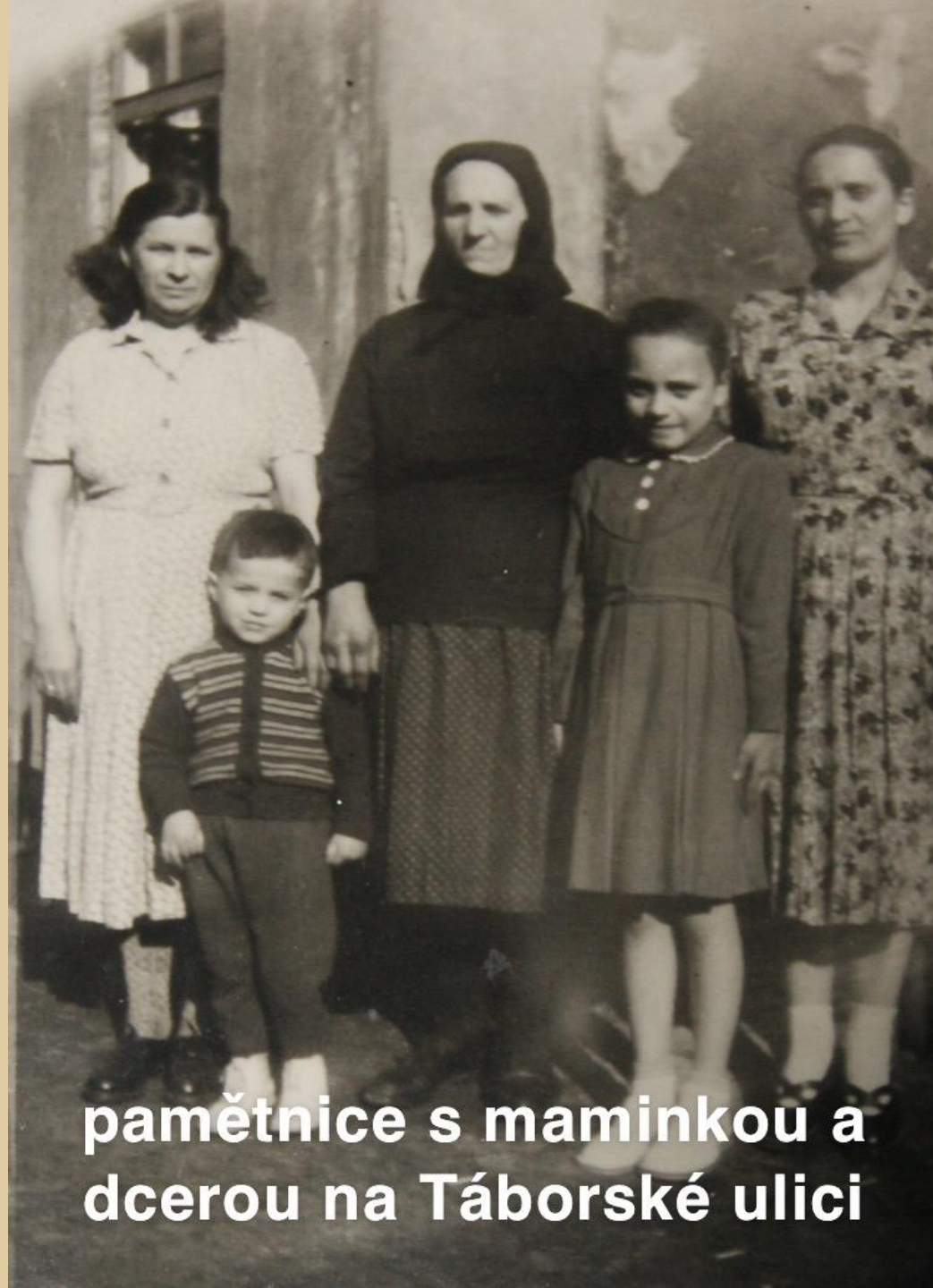
pamětnice s maminkou a dcerou na Tábořské ulici