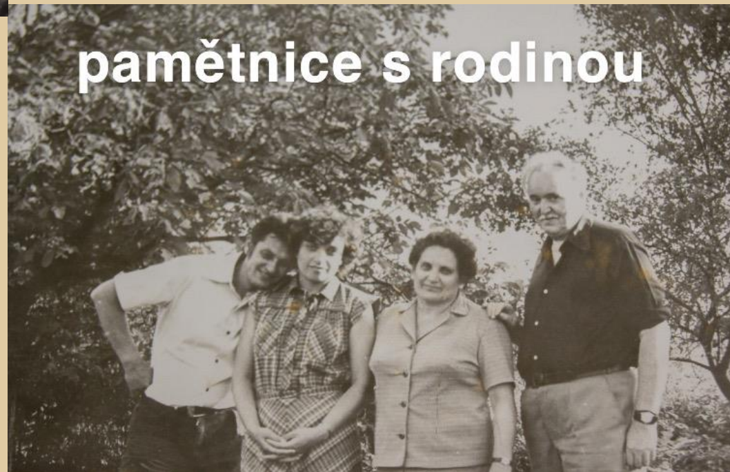
pamětnice s rodinou

Měla sestru o 14 let starší a bratra 13 let staršího