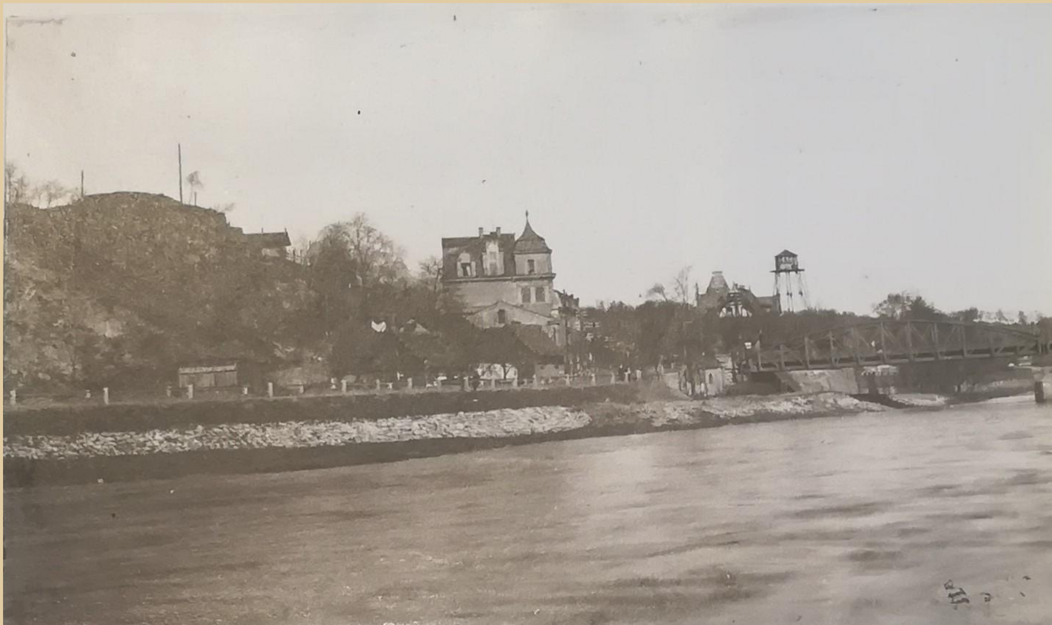
SOkA K. Vary, fond Obecní úřad Drahovice, kronika