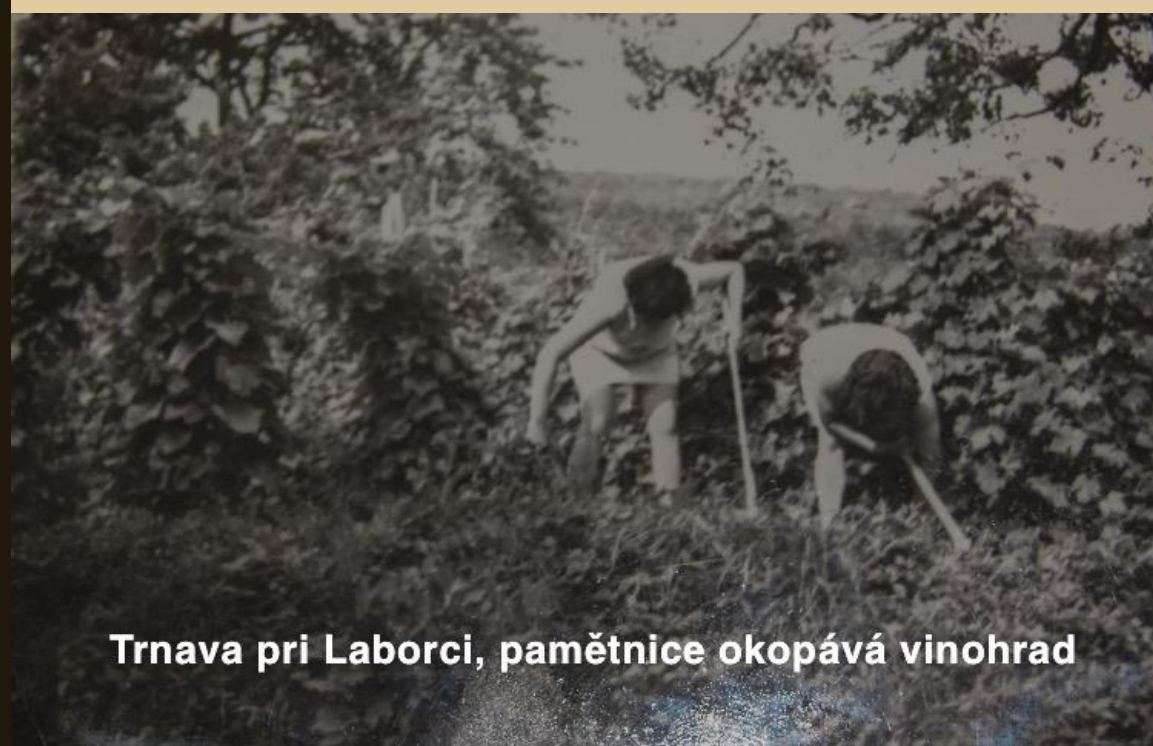
Trnava pri Laborci, pamětnice okopává vinohrad

Oba její rodiče pracovali v rodinném zemědělství.