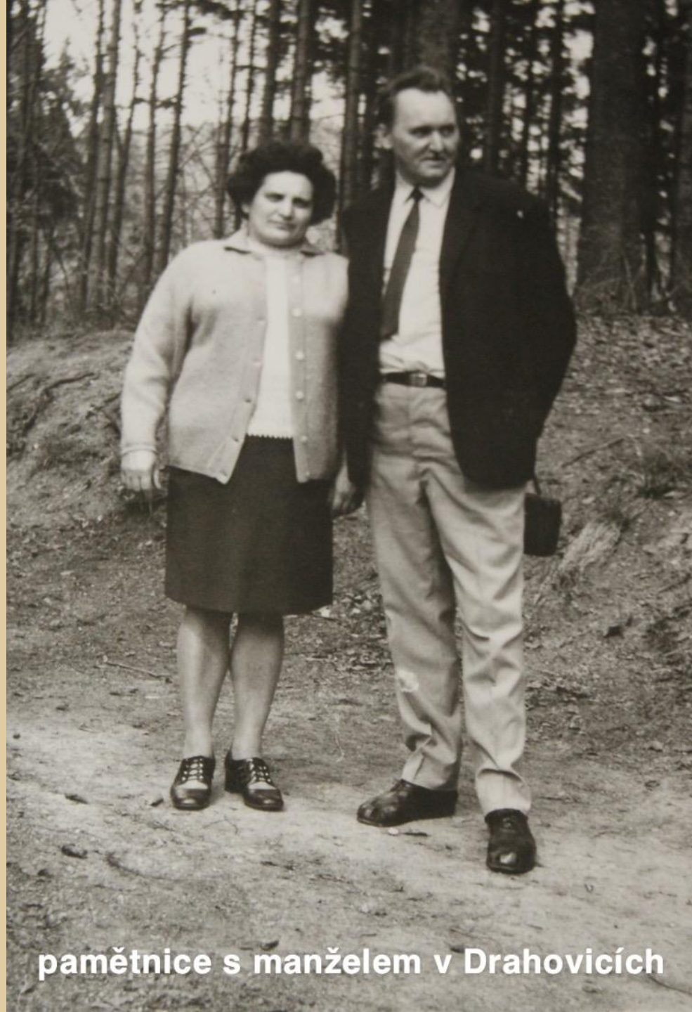
pamětnice s manželem v Drahovicích