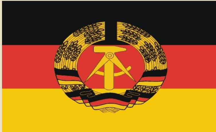
Vlajka Německé demokratické republiky