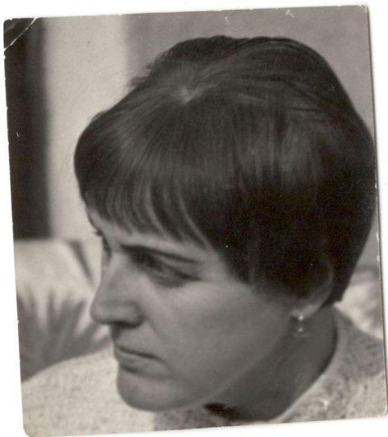
Portrét, Byšice 1969

„...budme rádi, že je mír a že je ten svět u nás, tak jako je...“