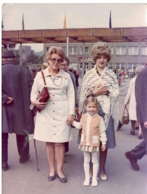
Na Zahradě Čech s dcerou a vnučkou, asi 1975-76