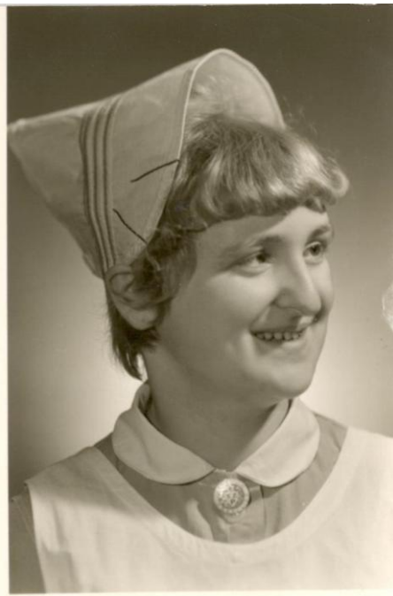
Maturitní foto dcery ze SZŠ