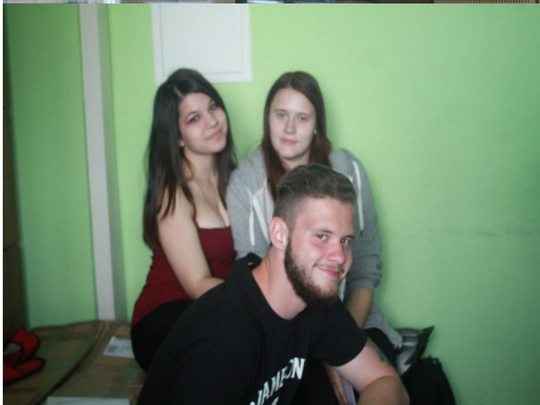
Natáčení reportáže v Rádiu Signál v Mladé Boleslavi