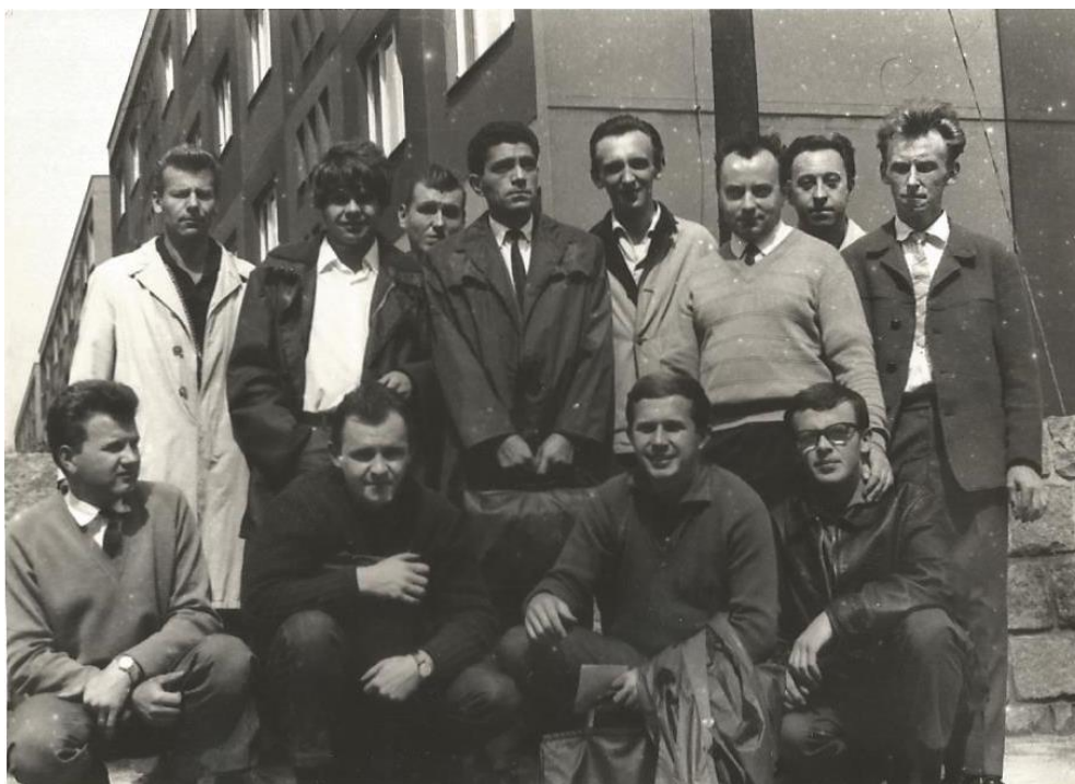
Strojní průmyslovka, 1966, stojí třetí zprava