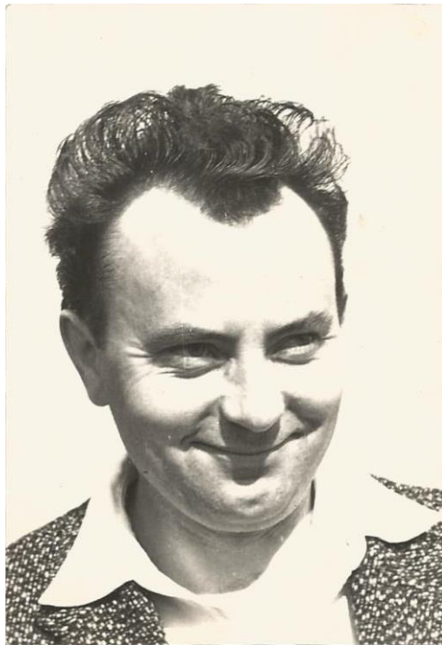
Portrét z dob studia na zahradnické škole, druhá polovina 50. let

Nedej zahynouti nám ni budoucím, svatý Václave!