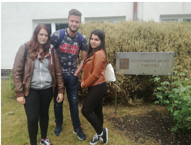
Hledali jsme i v archivu na Mělníku