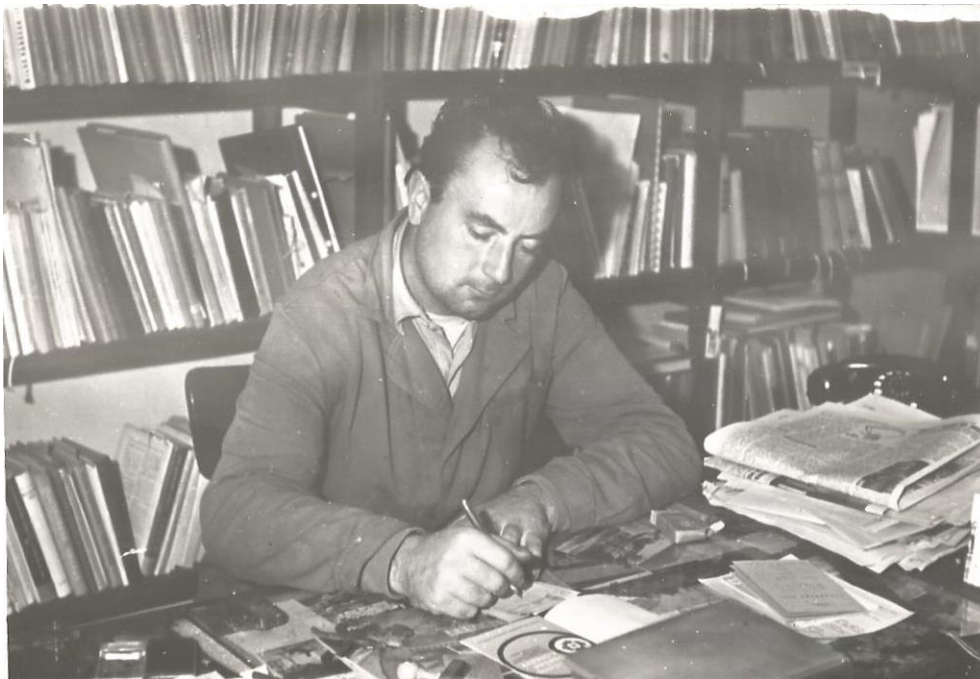
Kancelář náměstka mělnické Liberty, asi 70. léta

Nejdéle pracoval v mělnické Libertě, továrně na výrobu dětských vozidel, dokonce ve funkci technického náměstka. Sice jako zarputilý nestraník dostal na čas výpověď a byl nahrazen „uvědomělým kádrem“, po určité době ho poprosili, aby opět svůj resort uvedl do pořádku.