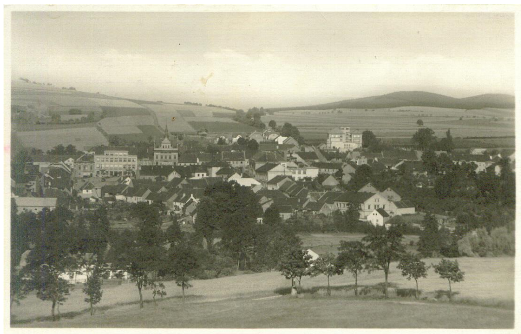
Sedlčany v roce 1934